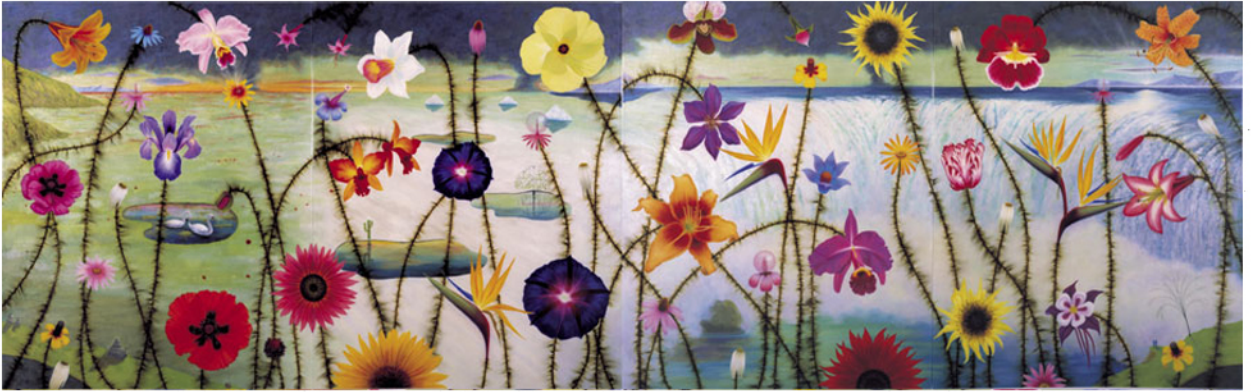
L. C. Armstrong, 'Scenic overlook', 1999.